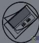
当护卡膜大小不合适时(图A)